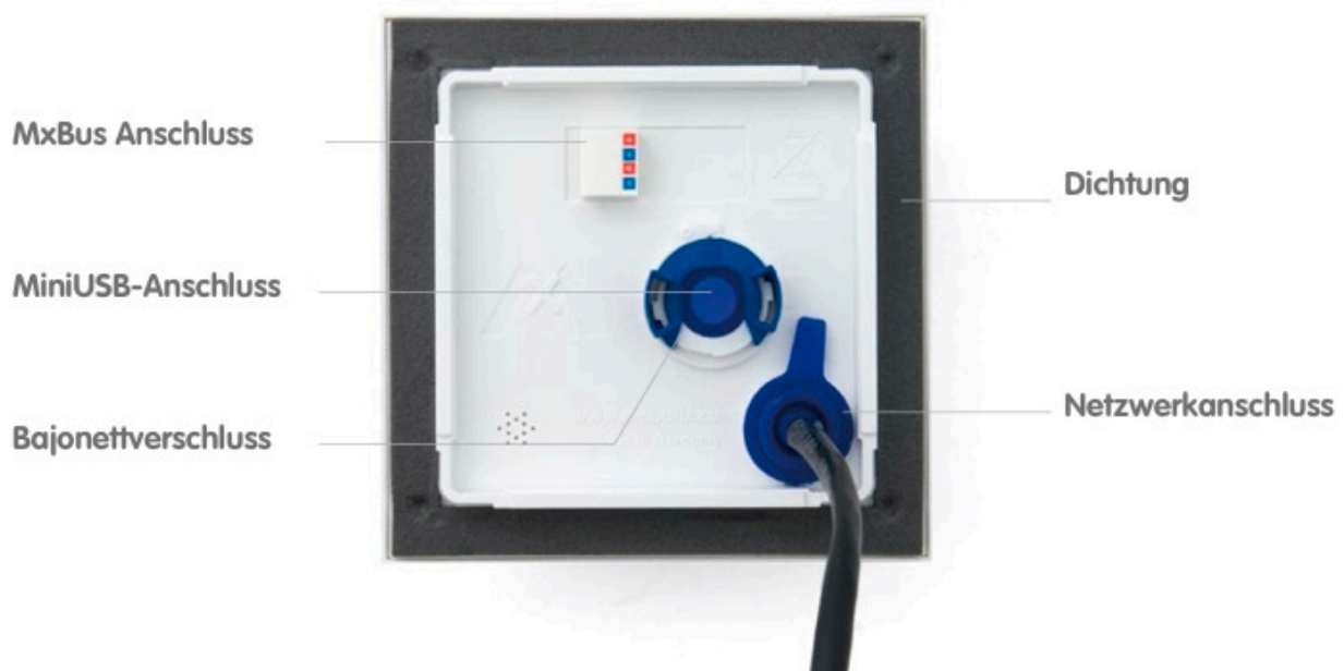
(T25 – Kameragehäuse und Anschlüsse, Auszug aus der technischen Dokumentation)